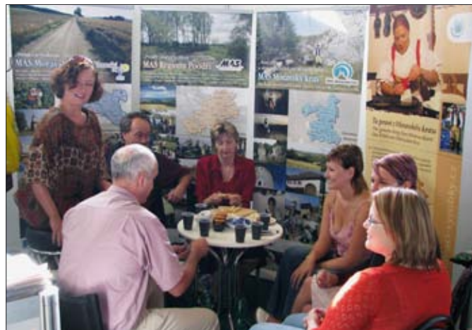
Prezentace MAS Moravská cesta, Moravský kras a Region Poodří na Zemi živitelce, 2008

kteří požadovaly navýšení rozpočtu pro III. a IV. osu, což se jim oproti původním návrhům částečně povedlo. V průměru na jeden rok se má přes EAFRD rozdělovat přes 13 miliard korun. Pro venkovské osy III. a IV. to budou téměř 3 miliardy korun ročně.