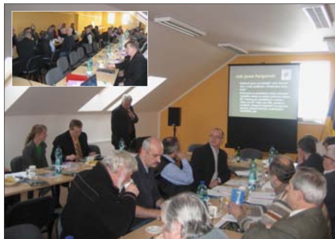
Jednání SPOV Moravskoslezského kraje v Horních Tošanovicích