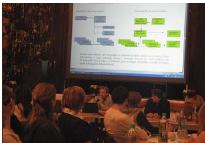
Setkání MAS z celé země v Týnci nad Sázavou, 2008

Program rozvoje zemědělství a venkova SAPARD 2000–2004 rozšířil zaměření na rozvoj zemědělství a životního prostředí, a také podnikatelské aktivity, zavedl využívání místních rozvojových strategií území sdružených obcí do tzv. mikroregionů (dobrovolných svazků obcí – DSO). Další tři roky převládala orientace buď na zemědělství a životní prostředí, nebo na regionální politiku. Roční podpora ze SAPARDu dosahovala 220 milionů korun. Program dal podnět k zakládání svazků obcí podle nového zákona o obcích a přinesl 210 místních rozvojových strategií. Projekty z venkova musely být v souladu se strategií a byly vybírány na místní úrovni. (Program se přiblížil iniciativě LEADER zavedené v EU v roce 1991.) Hlavním přínosem byla modernizace zemědělských podniků a zavádění en-