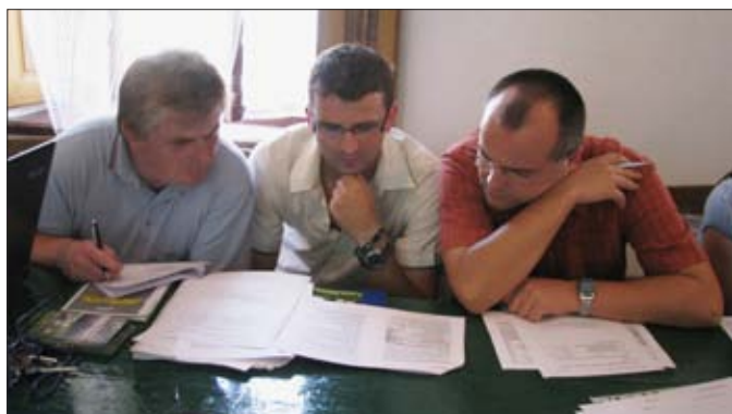
Školení výběrové komise v MAS Moravská cesta, Příkazy 2008

Konečné podobě fondu v České republice předcházela široká diskuse i spory mezi nejrůznějšími zástupci zemědělských svazů na straně jedné a představitelů venkovských obcí, mikroregionů a MAS,