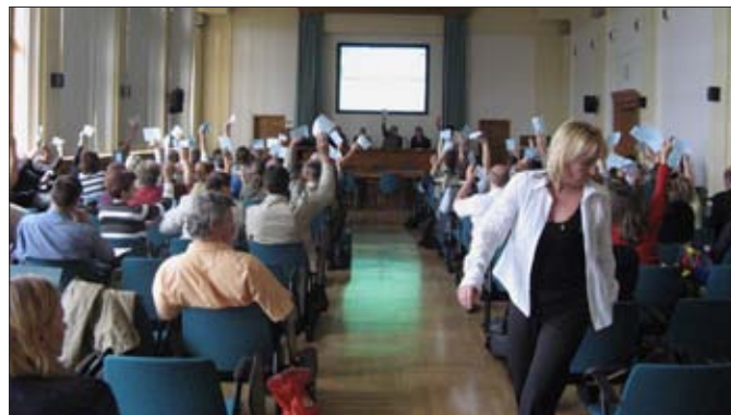
Valná hromada Národní sítě MAS, Praha, 2008

Podrobnější informace o počtech vybraných projektů z loňských výzev jednotlivých MAS zatím nejsou z MZE ani SZIF k dispozici, stejně tak informace, kolik MAS již vypsal výzvy v letošním roce. Budeme-li předpokládat, že každá MAS vybrala v loňském roce